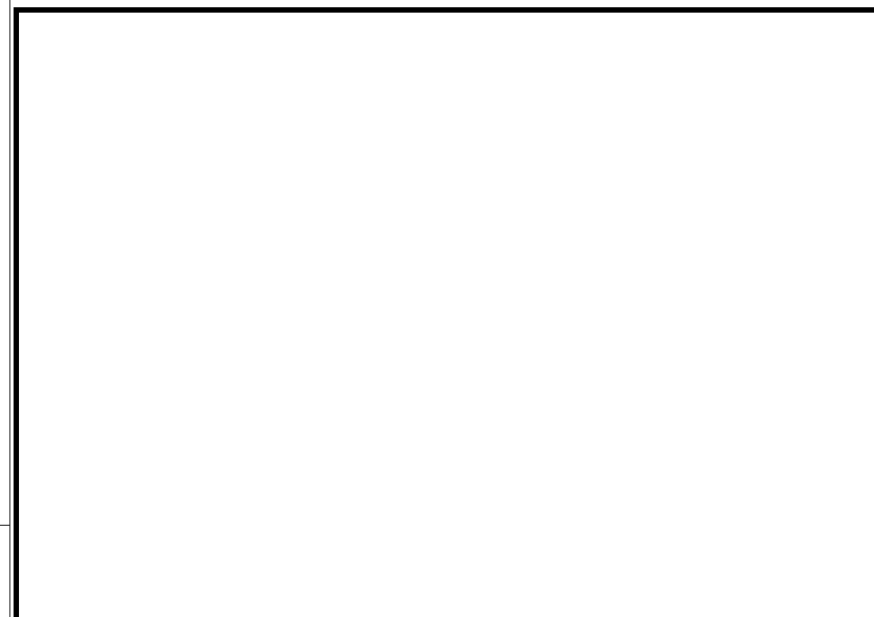
Moteur sans niche